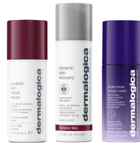
Dynamic Skin Retinol Serum Dynamic Skin Recovery SPF 50 Phyto Nature Oxygen Cream