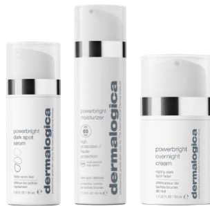
PowerBright Dark Spot Serum PowerBright Moisturizer SPF 50 PowerBright Overnight Cream