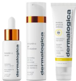
BioLumin-C Serum BioLumin-C Gel Moisturizer Invisible Physical Defense SPF 30